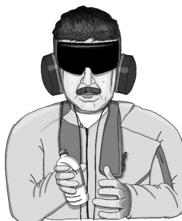
Nicolás Maduro na palubě USS Iwo Jima při transportu do New Yorku

Budoucnost země je nejistá. Nikdo přesně neví, co bude. Jistá je ale jedna věc. Tato událost se zapíše do dějin země a ovlivní mezinárodní politiku a životy milionů jejích obyvatel.